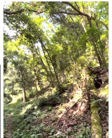
次回作業対象の枯損木

＜次回以降の枯損木対応＞ 枯損木について観察を行った下刈りと伐倒の同時作業は危険もあるので、次回の活動にて体制を整理して伐倒を行う方針とした。