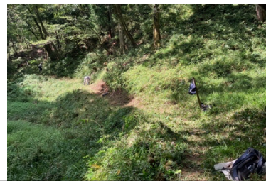
北の入り 下刈り 完了

＜次回以降の枯損木対応＞ 枯損木について観察を行った下刈りと伐倒の同時作業は危険もあるので、次回の活動にて体制を整理して伐倒を行う方針とした。