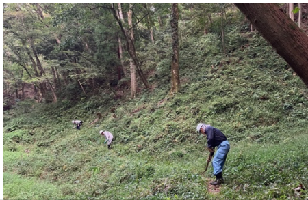
北の入り 下刈り作業中