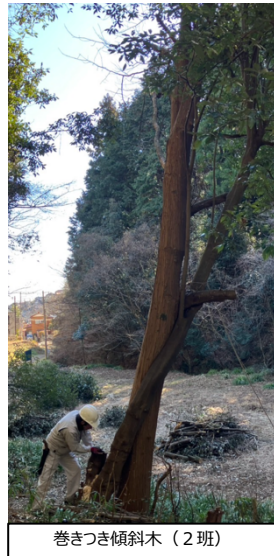
巻きつき傾斜木 (2班)