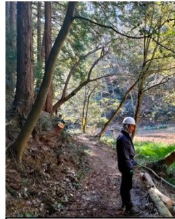
リョウブの伐倒 (1班)