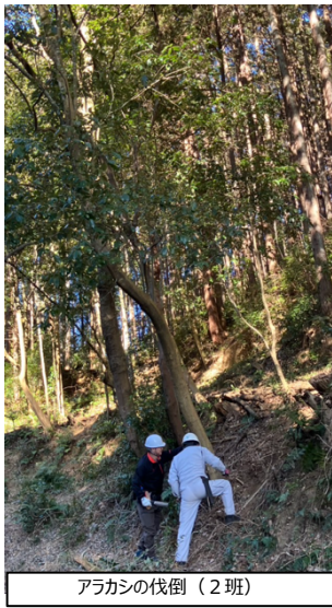
アラカシの伐倒 (2班)