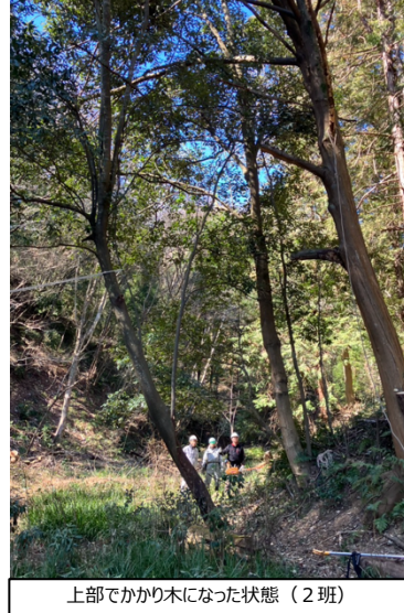
上部でかかり木になった状態 (2班)