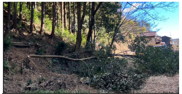
アラカシの伐倒 (2班)