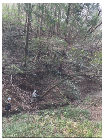
傾斜木（アラカシ）の伐倒（1班）