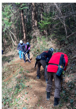
北の入り遊歩道の整備（1班）