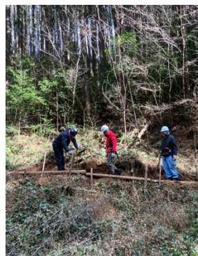
路肩の補強作業（1班）