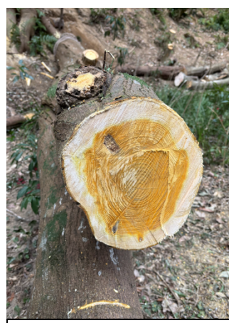
断面の内部が黄色になっていた